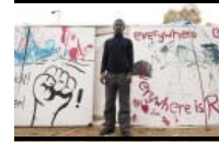
Das sind die Berliner Bilder des Tages